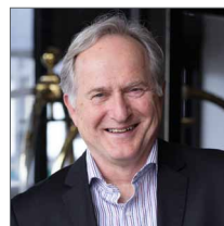
Par Luc Roy, comité Promotion et défense des droits des retraités

L'Observatoire de la retraite est une initiative de l'Institut de recherche en économie contemporaine (IRÉC). Pour plus d'information sur l'Observatoire de la retraite et le sommet, vous pouvez consulter le site www.observatoireretraite.ca .