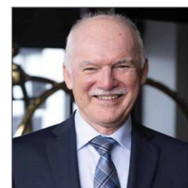
Par Pierre Gagné

N'hésitez pas à communiquer avec nous si vous souhaitez offrir vos services pour la suite de ce projet ou pour la préparation des conférences avec notre belle équipe de bénévoles!